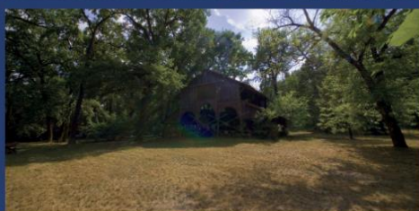
Natura 2000保护区 《Nagykőrös (大克勒什) 的草原上橡树林》