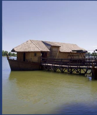
Ráckeve (拉茨凯韦) - 船磨坊