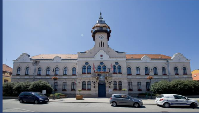
Ráckeve (拉茨凯韦) - 古市政厅