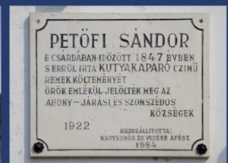
Kocsér (科切尔) - Kutyakaparó 饭店 ("小狗之挠"酒馆)