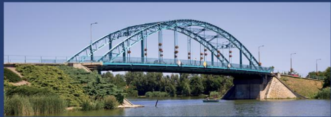
Ráckeve (拉茨凯韦) - Árpád 桥 (阿尔帕德桥)