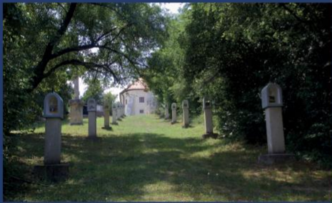
Pusztazámor (普斯特陶扎莫尔) 隐土地