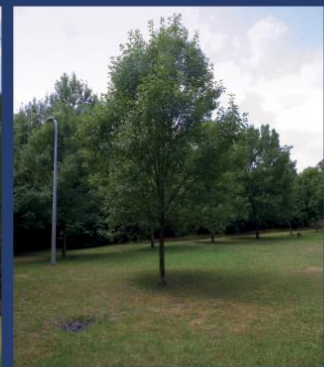
Nagykőrös (大克勒什) - Toldi Miklós (托尔迪·米克洛斯) 食品工业职业学校与宿舍的桤树