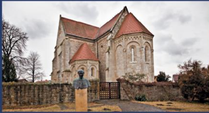
Ócsa (欧乔) 归正会纪念碑教堂