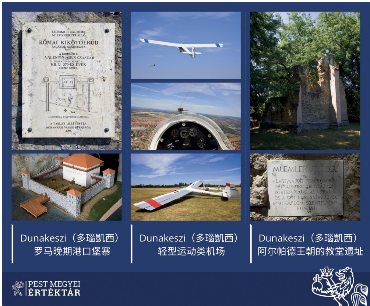
Dunakeszi (多瑙凱西) 罗马晚期港口堡垒