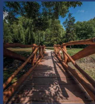
Pilis (皮利什) - Gerje 小溪 (格尔耶小溪) 及其源头