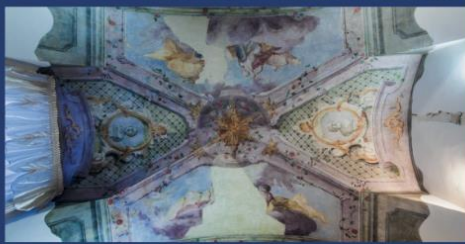
Pilis (皮利什) - Beleznay-Nyáry 宫殿 (贝列兹奈-尼亚里宫殿)