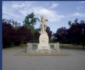
Isaszeg (伊沙塞格) 国防军纪念碑