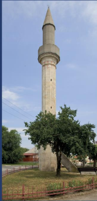
Érd (伊尔德) - 宣礼塔