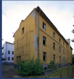
Kistarcsa (小陶尔乔) - 以前的集中营