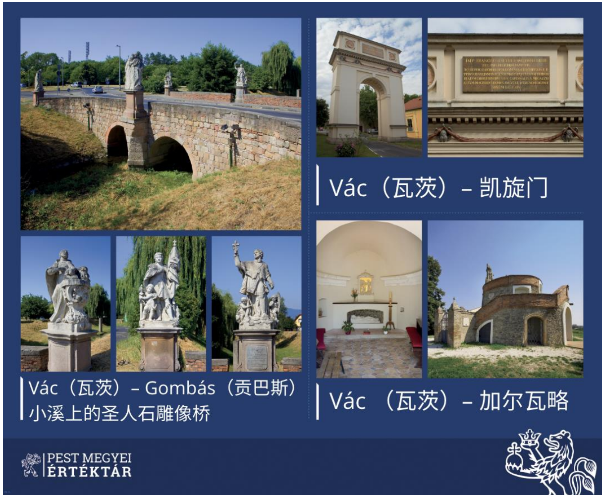
Vác (瓦茨) – 凯旋门