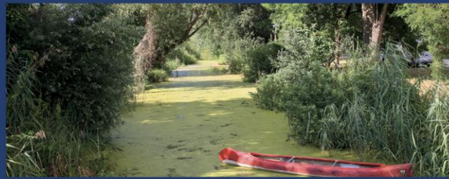
Ráckeve (拉茨凯韦) - 多瑙河支流的浮沼泽和生物群系