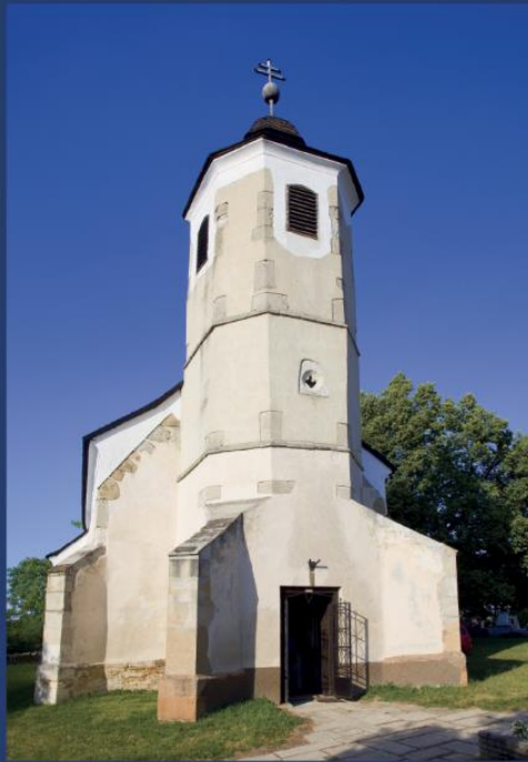
Isaszeg (伊沙塞格) 老教堂 - 圣马丁天主教堂