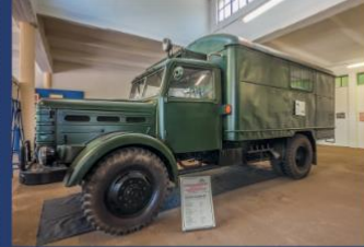
Szigetszentmiklós (锡盖特圣米克洛什) - Csepel (却贝尔) 汽车生产博物馆