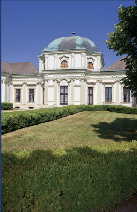
Ráckeve (拉茨凯韦) - Savoyai 宫殿 (萨瓦宫殿)