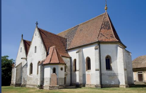
Ráckeve (拉茨凯韦) - 塞尔维亚 (圣母升天) 教堂