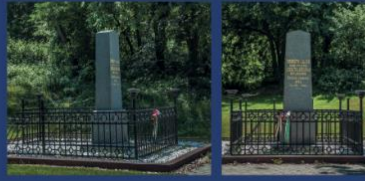
Dabas (道包什) - Kossuth László (科苏特·拉斯洛) 墓