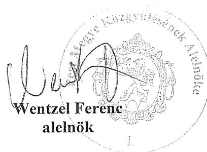
Wentzel Ferenc alelnök